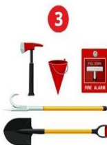
3 Пожарный инвентарь