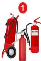
1 Переносные и передвижные огнетушители